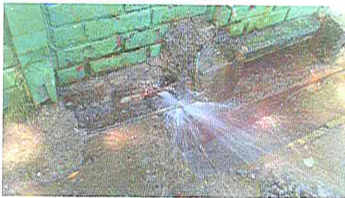
Foto de filtración en colegio CTP

Picar el pavimento hasta encontrar la cañería, realizar un acople de cañería galvanizada a cobre y reponer el pavimento.